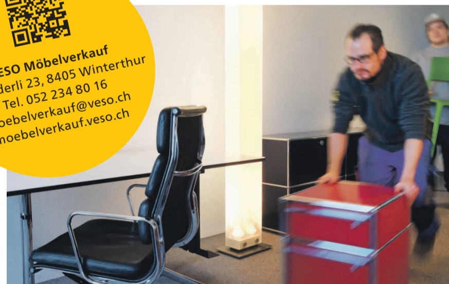
Showroom des VESO Möbelverkaufs, Im Hölderli 23, 8405 Winterthur