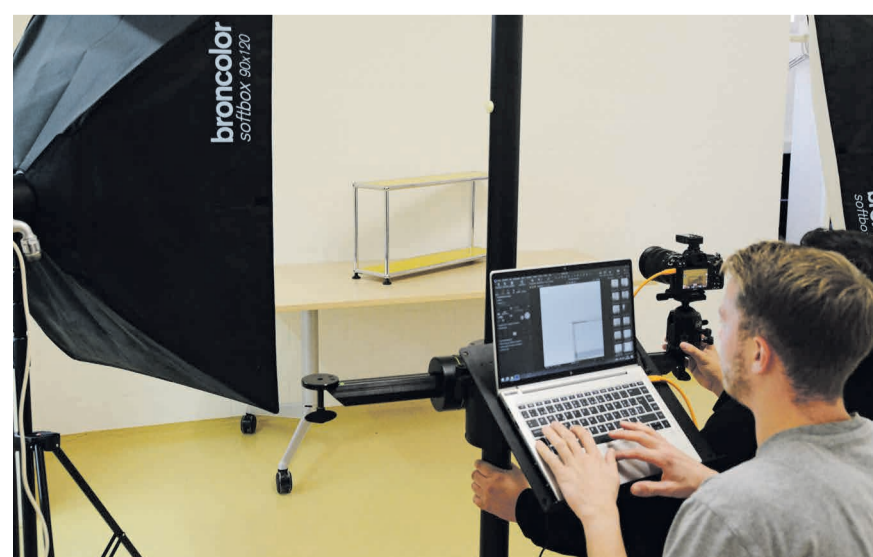
Vorbereiten eines Produktfotos im Fotostudio

Der VESO, der im 2023 sein 50-Jahr-Jubiläum feiert, ist die führende Institution für Sozialpsychiatrie in der Region Winterthur. Hier finden über 400 Menschen mit psychischer Beeinträchtigung und/oder sozialen Schwierigkeiten Unterstützung, damit sie ihren Alltag so selbstständig wie möglich bewältigen und sich in den Arbeitsmarkt eingliedern können. Dazu können sie beim VESO bedürfnisgerechte Angebote für Wohnen, Arbeiten und Beschäftigung nutzen. Die professionell geführte Institution beschäftigt in den Arbeitsbereichen, den Tagesstätten und den Wohngemeinschaften rund 80 Fachmitarbeitende. www.veso.ch