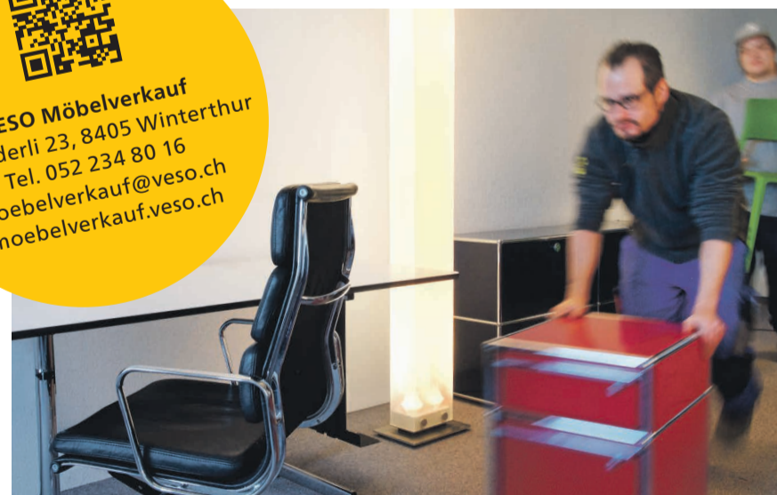
Showroom des VESO Möbelverkaufs, Im Hölderli 23, 8405 Winterthur